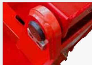
Dettagli costruttivi delle zone maggiormente sollecitate - Manufacturing features for the most stressed areas